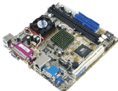
Boîtier de mini PC et carte mère avec un seul port PCI